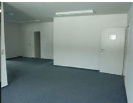
Büro - oben links