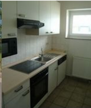
Küche oben links