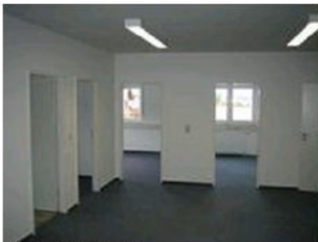
Büro - oben rechts