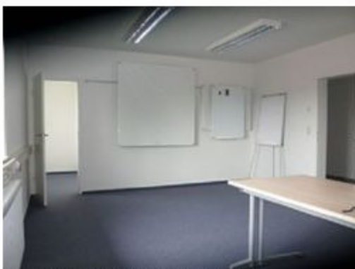
Büro / Schulung- mit Nebenraum